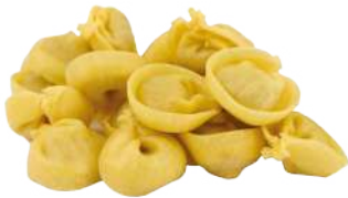
Tortellini crudo di Norcia IGP

La tradizione della pasta fresca all'uovo si unisce con l'eccellenza del prosciutto crudo di Norcia IGP, rinomato per il suo gusto delicato e la sua qualità certificata.