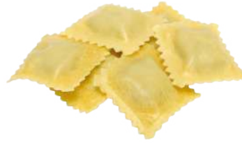
Ravioli porcini e tartufo

Una ricetta gourmet prelibata, con un ingrediente prezioso e ricercato dalla nostra regione Marche.