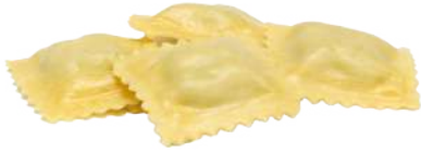
Ravioli cacio e pepe

Un abbinamento perfetto tra la sapidità del pecorino romano DOP unito al sapore pungente del pepe nero.